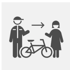
⑤ショップで商品を受け取る

■公式オンラインストア URL : https://store.bscycle.co.jp/