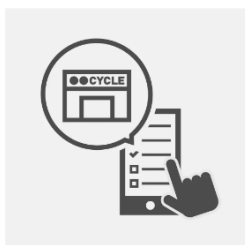
②受け取るショップを選択