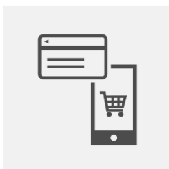
③オンラインストアでお支払い