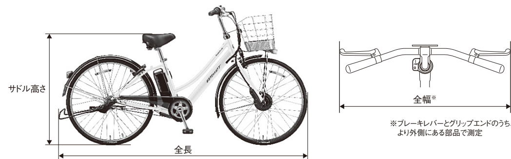
自転車の画像は代表例です