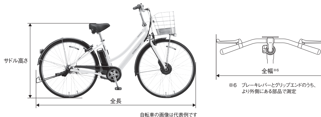
自転車の画像は代表例です